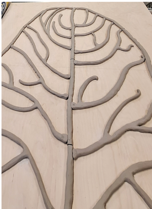
Iz cikla Folium , 2023–2024, žgana glina