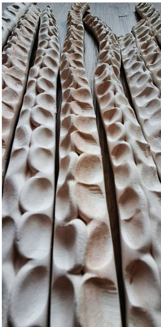
Iz cikla Folium , 2023–2024, žgana glina