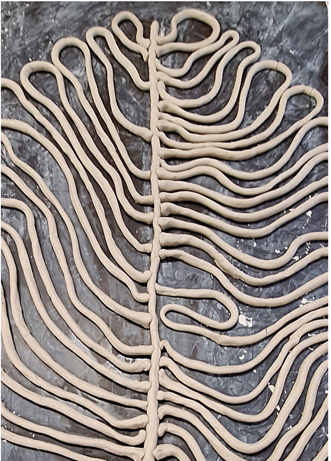
Iz cikla Folium , 2023–2024, žgana glina