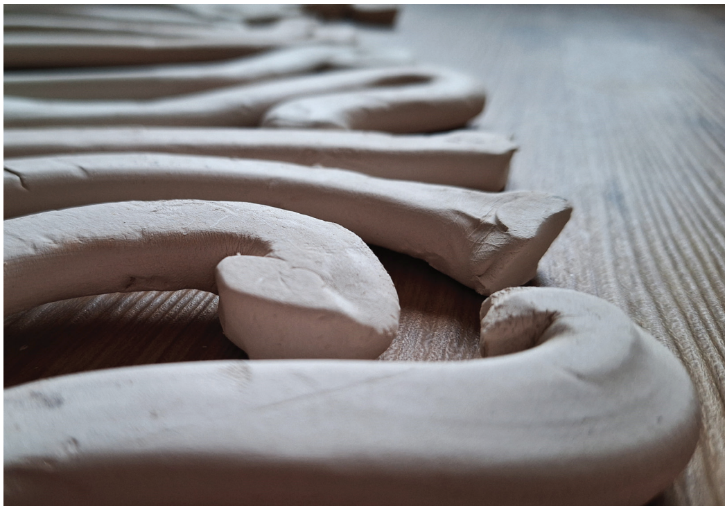
Iz cikla Folium , 2023–2024, žgana glina

Umetniška vrednost razstave je v tankočutnem delovanju na več nivojih: preoblikovanju repinca v serijo privlačnih umetniških izdelkov, razstava v galeriji v Žalcu umešča njeno delo v svet umetnosti in ji podeljuje žarenje in razvidnost, je oda listu zdravilne in hranilne rastline in opomin za krhko lepoto gozdnega ekosistema in travnika ob Savinji. Je tudi poklon ženskam gozdarkam, ki jih je v Sloveniji 40 % in težijo k ohranjanju gozda. In nenazadnje je to tudi upor proti brezbriznosti do planeta in poziv k cenjenju tega, kar bomo predali svojim rodovom.